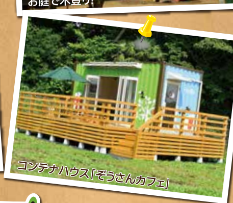
コンテナハウス「ぞうさんカフェ」