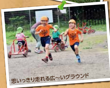
思いっきり走れる広～いグラウンド