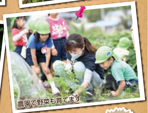
農園で野菜も育てます