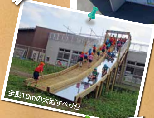
全長10mの大型すべり台