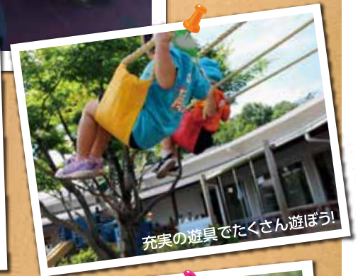
充実の遊具でたくさん遊ぼう!