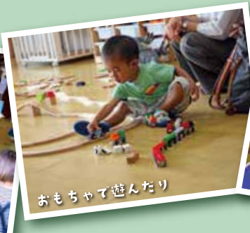
おもちゃで遊んだり